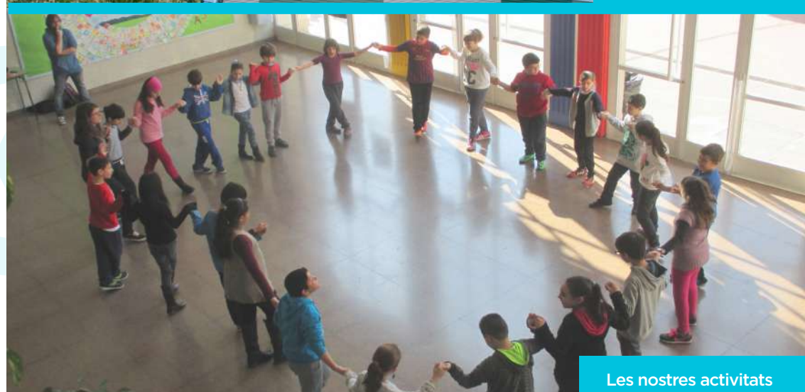
Les nostres activitats