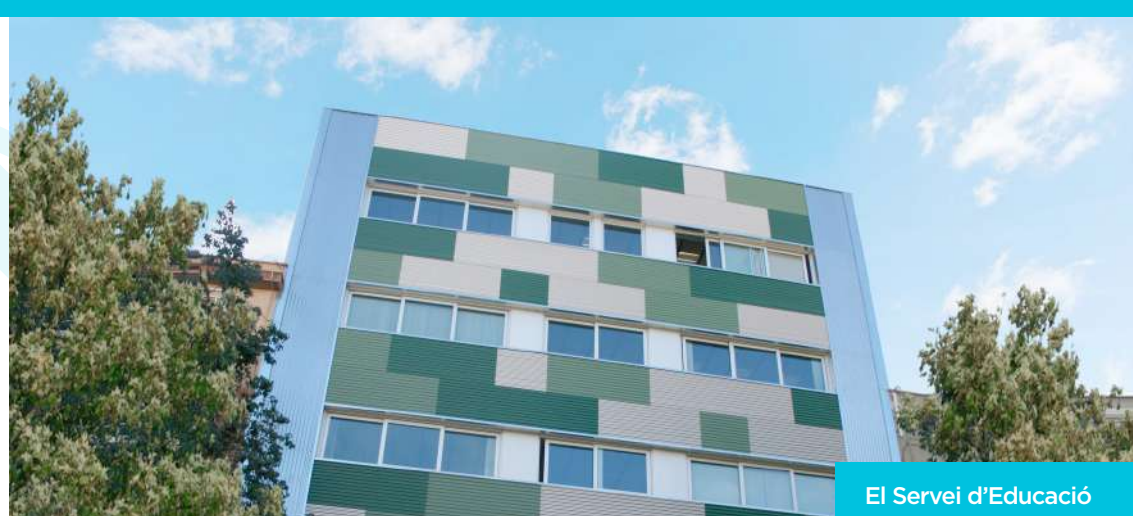
El Servei d'Educació

Vetllar perquè l'educació de Santa Coloma de Gramenet sigui de qualitat, s'adeqüi a les necessitats de la ciutadania i que els recursos públics es gestionin amb eficàcia.