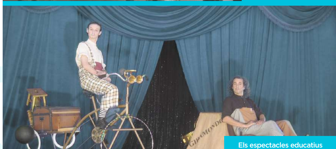
Els espectacles educatius