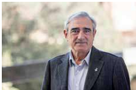
Alfredo Vega Alcalde de Terrassa

La cultura ens enriqueix, ens aporta noves experiències, ens fa créixer i ens permet expressar-nos. En definitiva, la cultura ens fa més lliures.