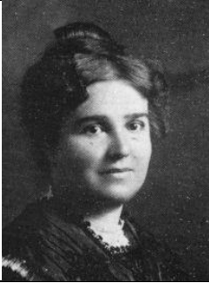
Rosa Sensat (1873 – 1961)

Va ser una mestra que contribuï al desenvolupament de l'escola pública catalana durant el primer terç del segle XX. Per haver desenvolupat una important tasca a Catalunya, tant a nivell de divulgació de nous corrents i experiències, com per la seva capacitat d'organització de centres escolars, portà a un col·lectiu de mestres a fundar l'any 1965 l'Escola de Mestres Rosa Sensat.