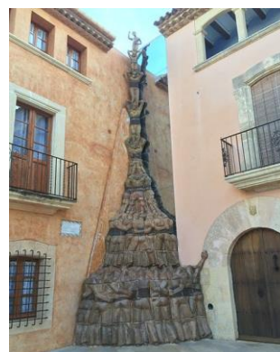
Homenatge al moviment casteller (Altafulla)