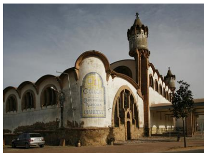
Cooperativa agrícola de Gandesa (1920)

Les imatges, patrimoni industrial de Catalunya