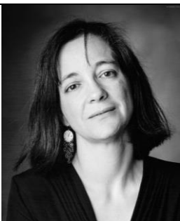
Maria Mercè Marçal (1946 – 1991)

També és destacable la seva tasca com a periodista, des de la qual manifesta la voluntat per construir una tradició de periodisme culte, feminista i de recuperació de la memòria històrica del país.