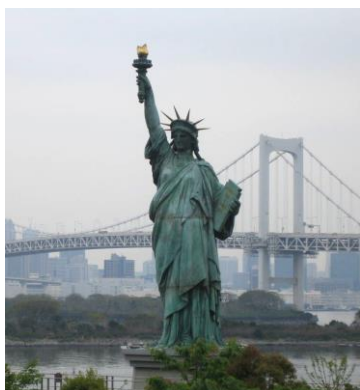
L'estàtua de la Llibertat (Nova York)