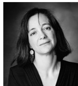
Maria Mercè Marçal, poeta (1952-1998)