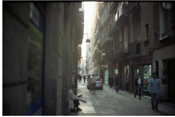
Raval, antic barri xino (Barcelona)