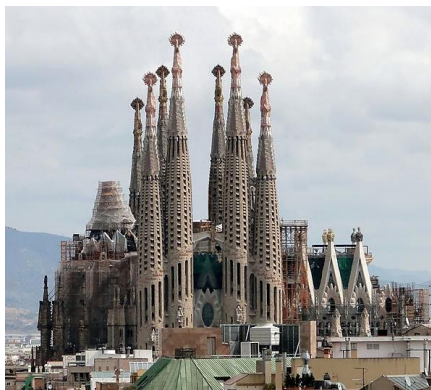
La Sagrada Família (Barcelona)