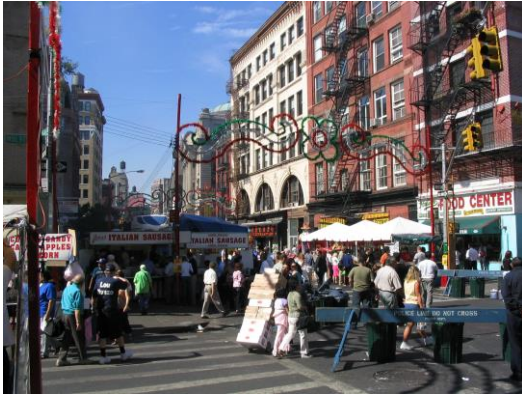
La Petita Itàlia (Manhatan)