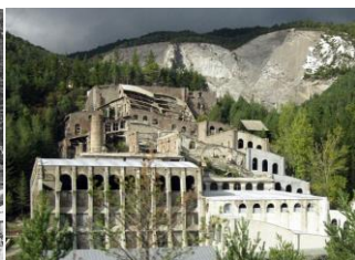
Museu del ciment Asland (Castellar de n'Hug, 2006)