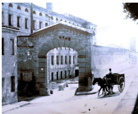
La Igualadina cotonera (Igualada)