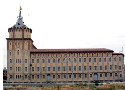
Farinera del Sindicat Agrícola de Cervera