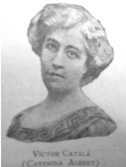
Caterina Albert (1869 – 1966)

Va ser una mestra que contribuï al desenvolupament de l'escola pública catalana durant el primer terç del segle XX. Per haver desenvolupat una important tasca a Catalunya, tant a nivell de divulgació de nous corrents i experiències, com per la seva capacitat d'organització de centres escolars, portà a un col·lectiu de mestres a fundar l'any 1965 l'Escola de Mestres Rosa Sensat.