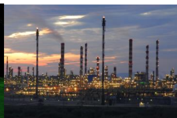
Polígon Nord, La Pobla de Mafumet (Tarragona)