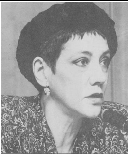
Montserrat Roig (1946 – 1991)

El premi als Jocs Florals del 1898 va representar el primer reconeixement de la seva capacitat literària. No trigaria gaire temps a utilitzar el pseudònim de Víctor Català, nom del protagonista d'una novel·la seva inacabada.