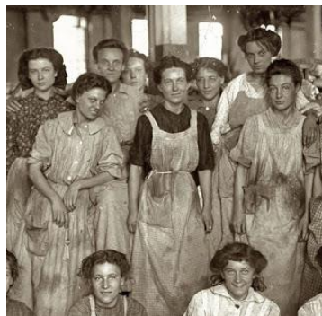
Treballadores tèxtils Mill Cotton Company (Nova York, 1908)