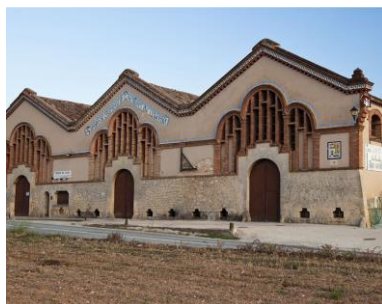
Celler cooperatiu de Rocafort de Queralt