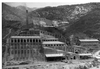
Fàbrica de ciment Asland (Castellar de n'Hug, 1905)

Les imatges, canvis temporals i/o funcionals