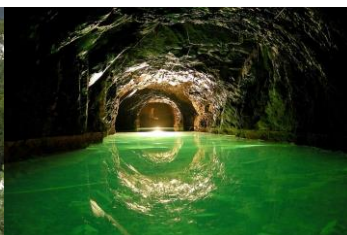
Mina del petroli de Riutort, Berguedà