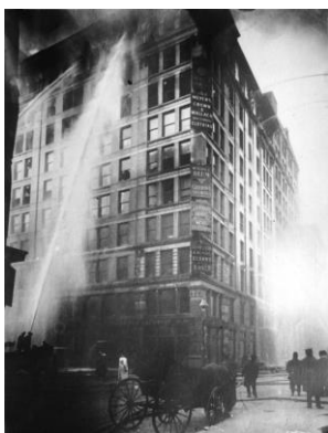
Fàbrica Triangle (Nova York)

Les imatges, algunes fàbriques de Catalunya i la fàbrica Triangle