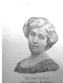
Caterina Albert, escriptora (1869-1966)