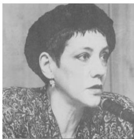
Montserrat Roig, escriptora (1946-1991)