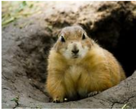
Cau de marmota