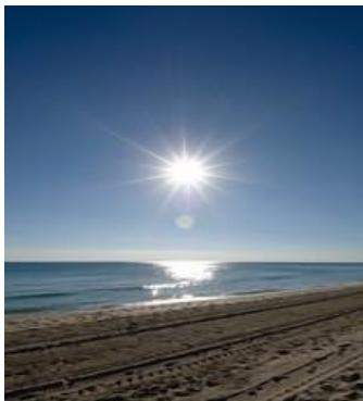
Llum del sol