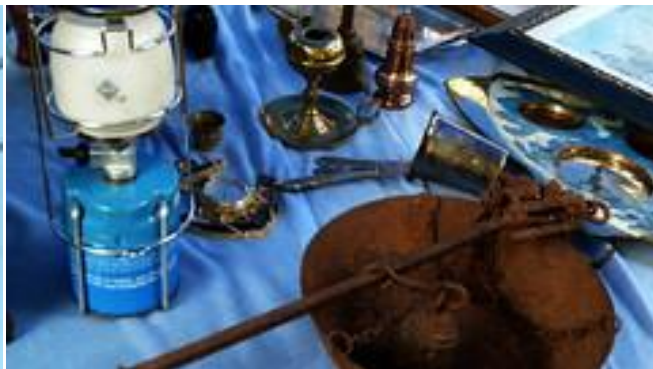
Enllumenat de gas