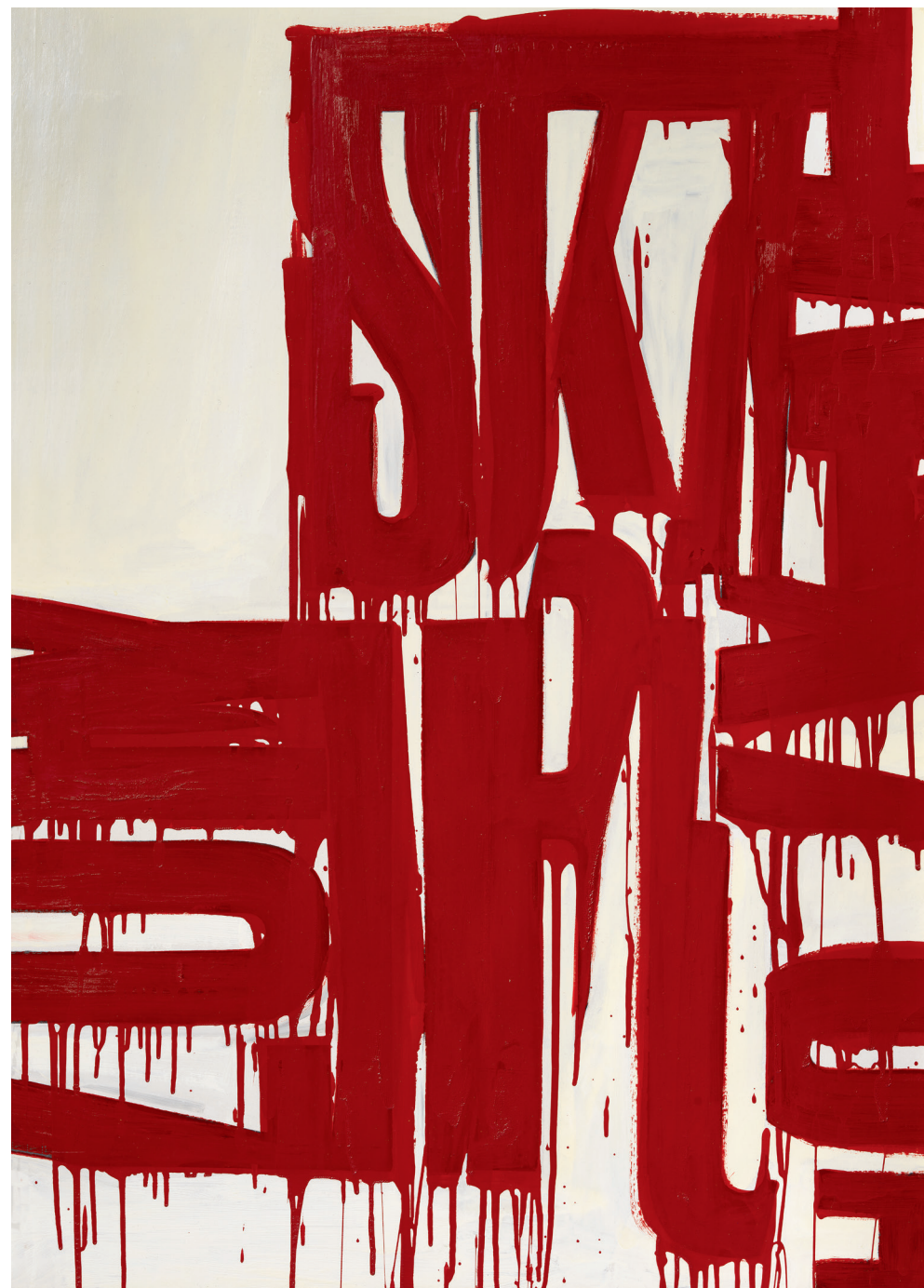
Pintura Lletrista, c. 1960