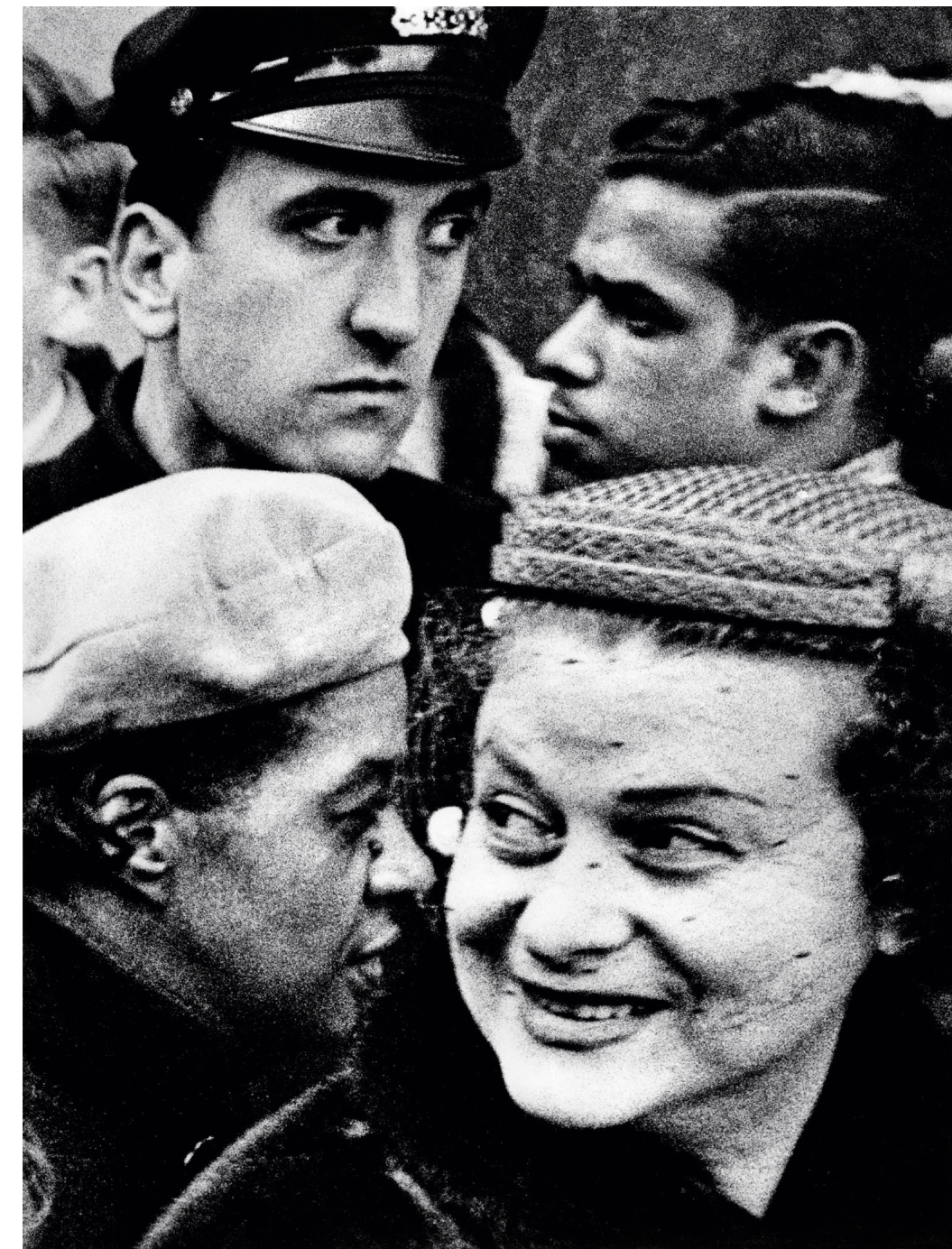
4 caps, Nova York, 1954