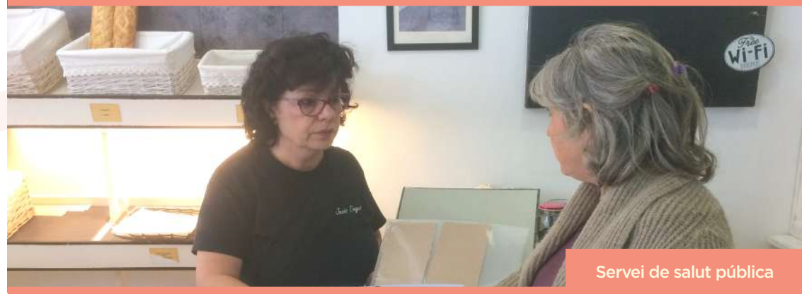
Servei de salut pública