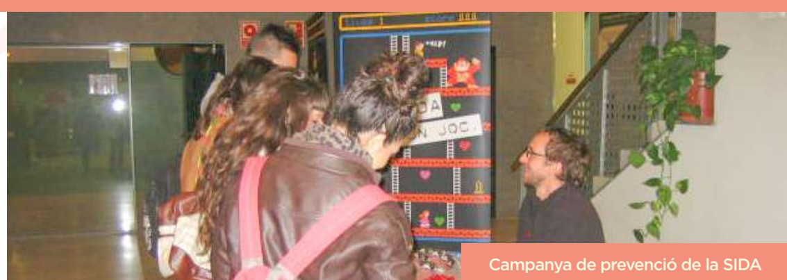
Campanya de prevenció de la SIDA