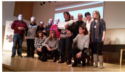
Acte entrega del Premi Bones Pràctiques ALF 2016

https://www.naciodigital.cat/manresa/noticia/63863/ampans-biblioteca-balsareny-premi-bones-practiques-lectura-facil-2016