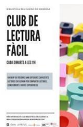
Cartell CLF Casino & Canonge