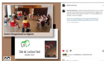
CLF Sant Fruitos & CO sagrera