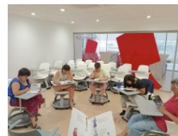
CLF Sant Vicenç & CO Encaix