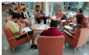
CLF Santpedor & CO Llum