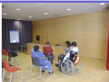
Club de Lectura Fàcil- Icària