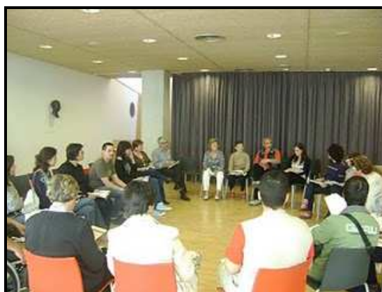
Imatge de la Cloenda CLF. Sala polivalent de la Biblioteca Marcel·lí Domingo

Per la seva part la Generalitat de Catalunya també ha volgut premiar a la Biblioteca Marcel·lí Domingo oferint-li diverses activitats de promoció lectora que s'hauran de desenvolupar al llarg del nou curs; l'objectiu d'aquesta nova actuació serà la d'ampliar i consolidar la tasca iniciada a partir del Pla Pilot de LF.