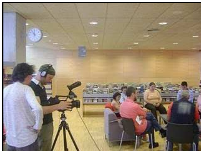
Gravació al Club de Lectura Fàcil per a discapacitats a la sala d'audiovisuals de la biblioteca Marcel·lí Domingo

L'experiència dels Clubs amb discapacitats mentals de la biblioteca Marcel·lí Domingo han estat considerats molt interessant i ens varen demanar de gravar uns minuts d'alguna sessió.