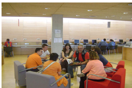
Club de Lectura Fàcil- Camp-redó