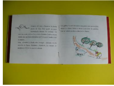
Las aventuras del perro Pastor 2008