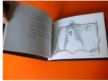
La tormentosa historia del verdugo y la princesa Verónica. 2010