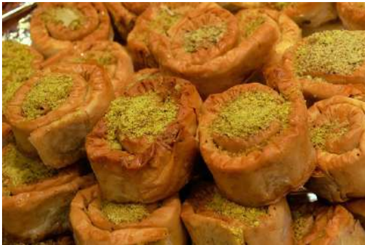
Dolços (típics de l'Ait el Firt)