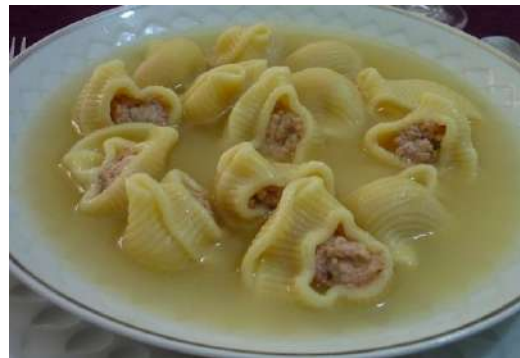
Sopa de galets (típica de Nadal)