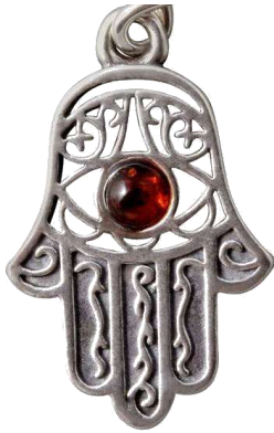
La mà de Fatma