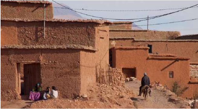
Casa tradicional amaziga