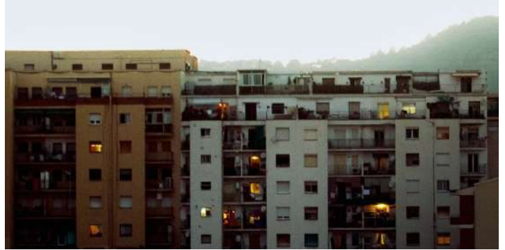
Edificis de Barcelona