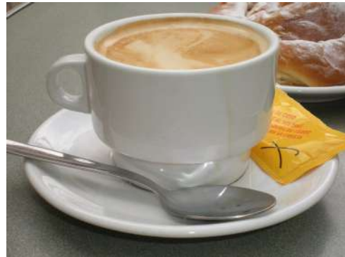
Cafè amb llet