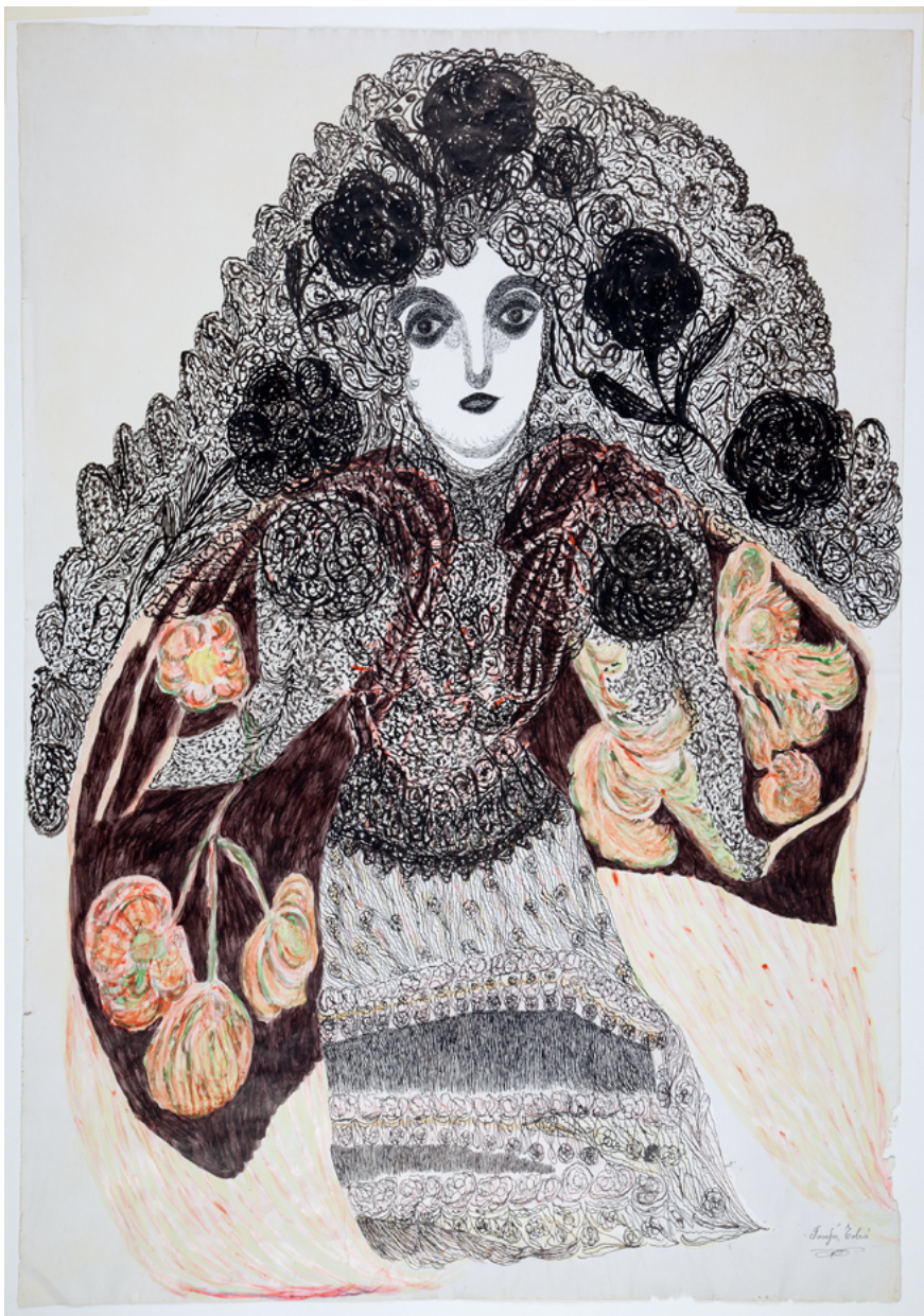
▲ Josefa Tolrà. Fundació Josefa Tolrà-Art Visionari

Les seves obres es van presentar en la Biennal de Venècia l'any 2022 i actualment es poden veure als museus internacionals, com el Museu Nacional del Prado, de Madrid; el MACBA, de Barcelona; o el Centre Pompidou, de París.