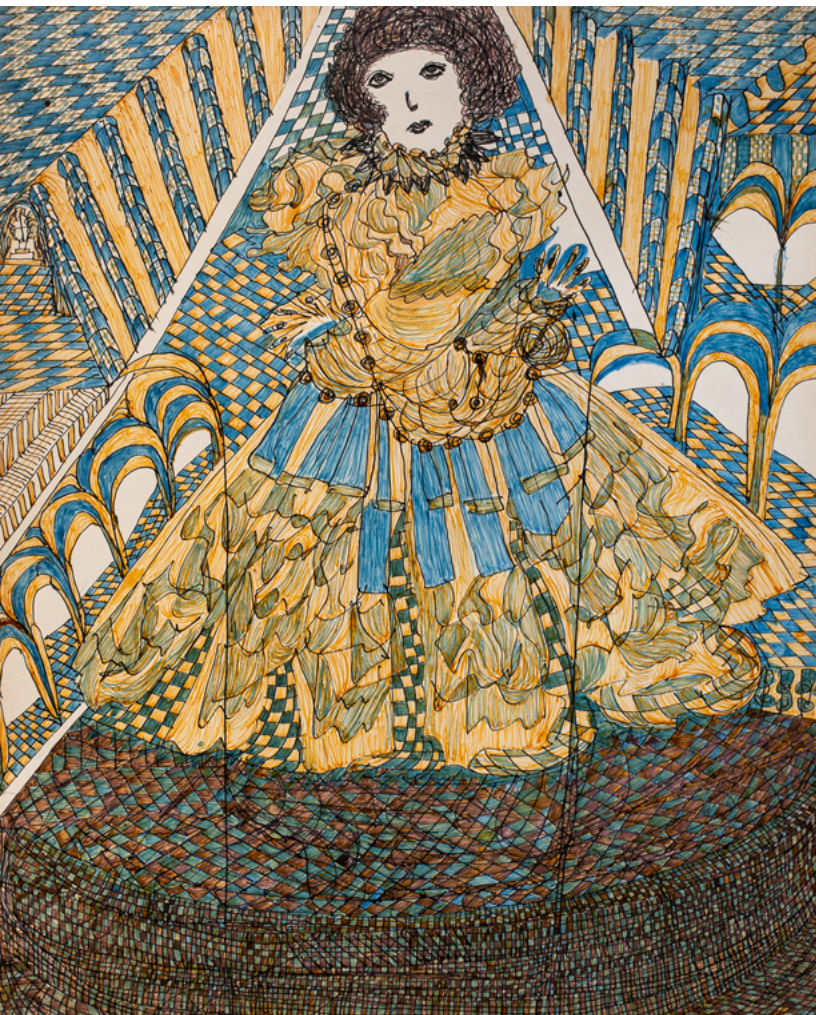
▲ Madge Gill. London Borough of Newham

Del 7 de juliol al 5 de novembre de 2023