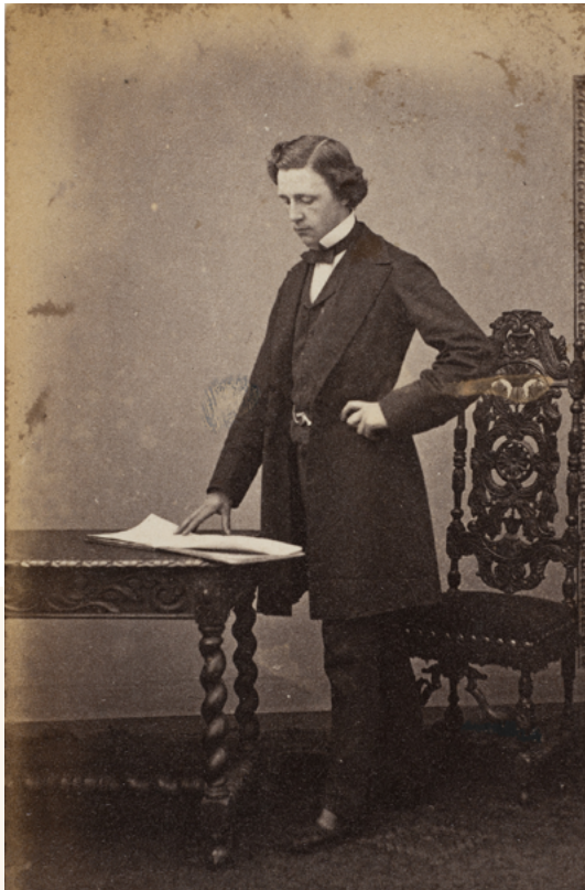
Charles Lutwidge Dodgson (1832-1898), álbum fotográfico familiar, siglo XIX. V&A: RPS.116-2021. Colección The Royal Photographic Society at the V&A, adquirido con la generosa contribución del National Lottery Heritage Fund y el Art Fund

Un matemático es una persona que estudia las matemáticas y que trabaja con números.