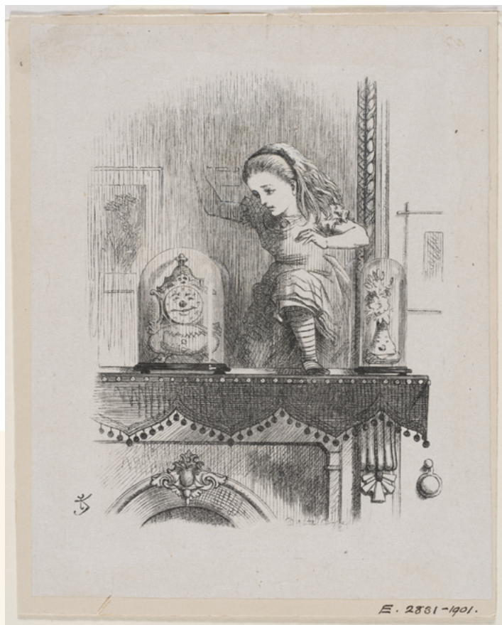
Ilustración de A través del espejo, grabado realizado por Dalziel Brothers a partir de un dibujo de Sir John Tenniel. E.2831-1901

Al principio, John Tenniel no pudo hacer los dibujos. Pero Lewis Carroll no encontró ningún dibujante mejor y esperó hasta el año 1869, cuando Tenniel ya pudo hacer las ilustraciones.