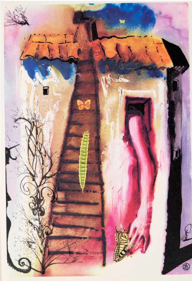
Salvador Dalí (1904-1989), Alicia en el país de las maravillas, «El Conejo envía un mensajero», 1969, heliogravado con anotación