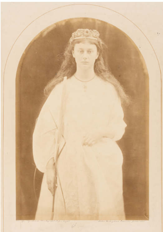
Fotografía de Alice Liddell como Santa Inés, realizada por Julia Margaret Cameron, copia a la albúmina, 1872

La protagonista es el personaje principal en una obra de teatro, en una película o en una novela.