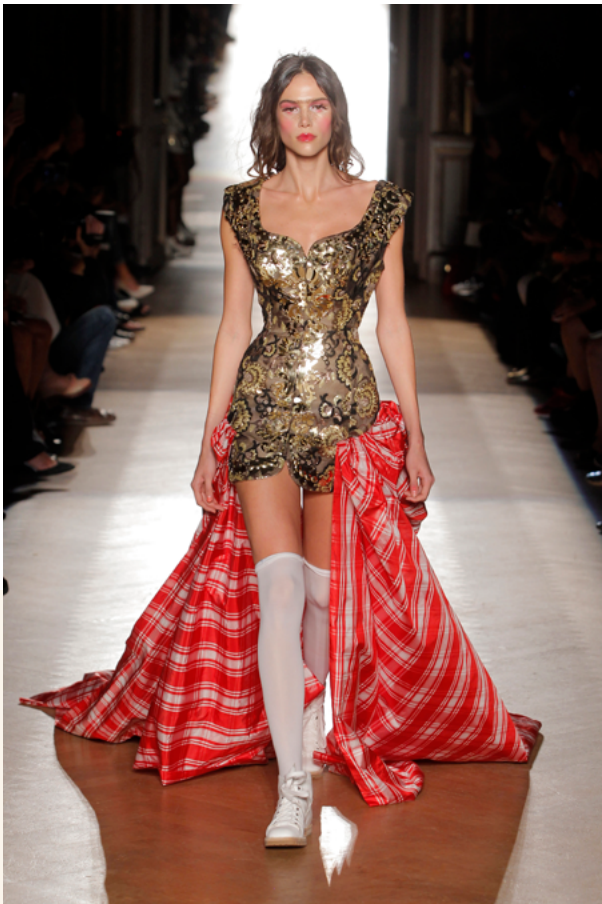
Gold Label (Etiqueta dorada), conjunto de Vivienne Westwood. Primavera/Verano, 2015