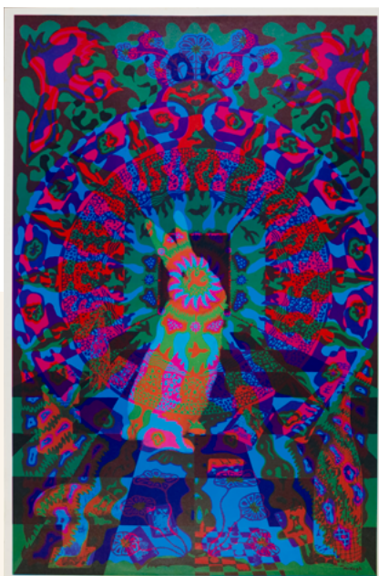
«El Conejo Blanco», cartel psicodélico de Joseph McHugh, publicado por East Totem West. EUA, 1967. Adquirido a través del Julie and Robert Breckman Print Fund

La psicodelia es una manera de hacer arte que utiliza colores vivos e imágenes extrañas. Quiere hacer sentir e imaginar cosas nuevas.