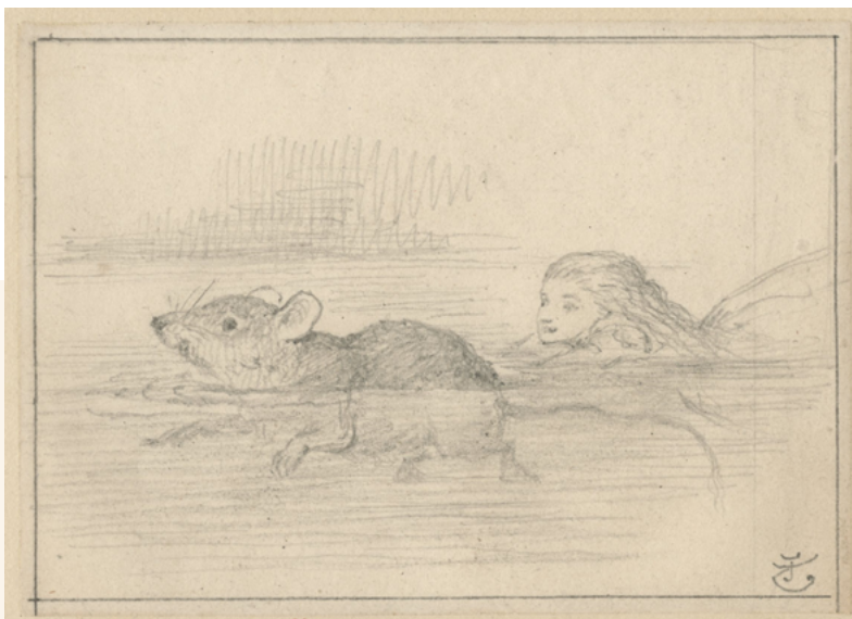
«El estanque de lágrimas», dibujo original de John Tenniel para Alicia en el país de las maravillas de Lewis Carroll, firmado con su monograma «JT»), c. 1870/1871

También empezaban a ir a la escuela y a tener un poco más de libertad.