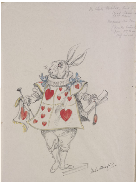
Vestuario diseñado por Gladys Calthrop para el Conejo Blanco en el Acto I, escena del juicio, de Alice in Wonderland , 1943. V&A: S.602-2012. Donación de Gladys Calthrop

Cada vez nos cuesta más entender el mundo, distinguir entre ficción y realidad, o saber quiénes somos. Esto también ocurre en el país de las maravillas.