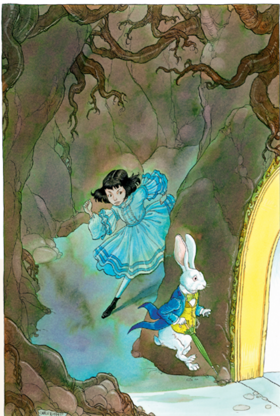
Dibujo de Alicia siguiendo al Conejo Blanco © Chris Riddell, 2019, reproducido con permiso de Macmillan International Publishers Ltd.

Hoy existen experiencias de realidad virtual sobre Alicia, que nos permiten vivir en el país de las maravillas como si estuviéramos allí de verdad.