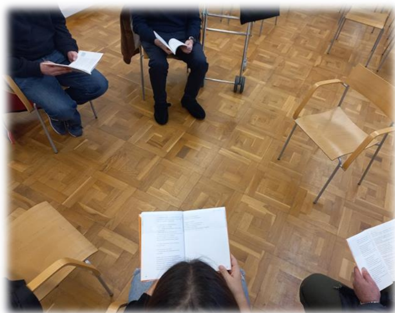
Grup de Lectura Fàcil participant a l'activitat.

Algunes d'elles s'han mantingut actives al grup durant més d'un any.