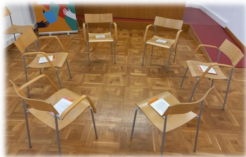
Sala de la Biblioteca Clarà.

Espai: Biblioteca Clarà. El 100% de les persones ateses mostren un elevat grau de satisfacció envers l'espai on es realitza l'activitat. La realització del grup a un equipament municipal com és la biblioteca facilita l'accés als llibres així com la participació en context natural i comunitari.