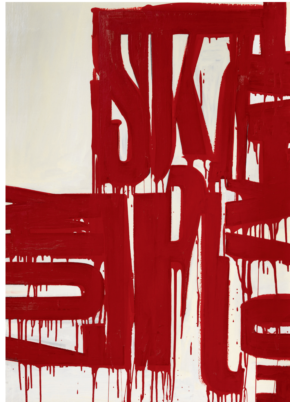
Pintura letrista, c. 1960