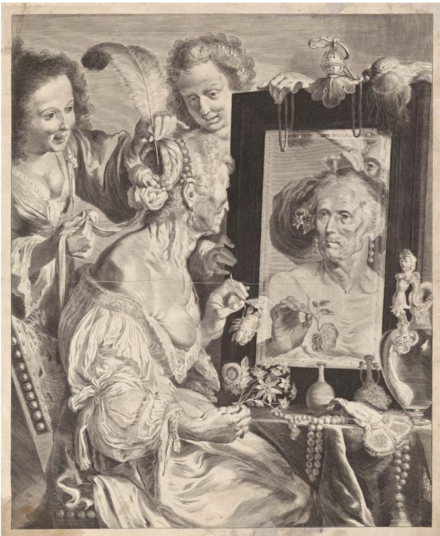
◀ Old woman at the mirror Jeremiasz Falck, after Bernardo Strozzi 1600s Gravat Wellcome Collection, London

Al principi eren objectes cars que només les classes benestants podien pagar.