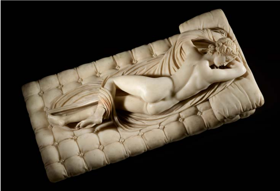
◀ Sleeping Hermaphroditus Autor desconegut Segle II d.C., Roma (original), Segle XIX d.C., Regne Unit (Reproducció) Marbre