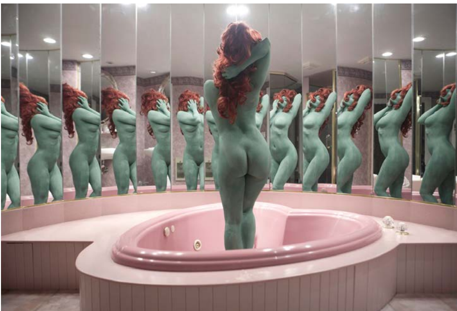
◀ A Dream in Green Juno Calypso 2015 Impresión digital de archivo

Asociar la belleza a estas virtudes devalúa la vejez o vincula la fealdad con el fracaso moral.