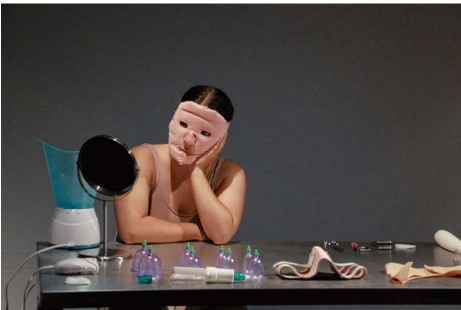
◀ Performing Femininity II Leia Goiria y Nuria Estremera 2021 Copia fotográfica

¿Podemos liberarnos de los cuerpos impuestos y conceder más importancia a la materia?