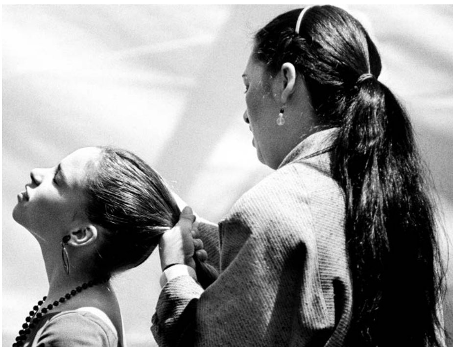
◀ Mare pentinant a la seva filla

Por ejemplo, el cabello de María Magdalena simboliza una libertad imposible de dominar.