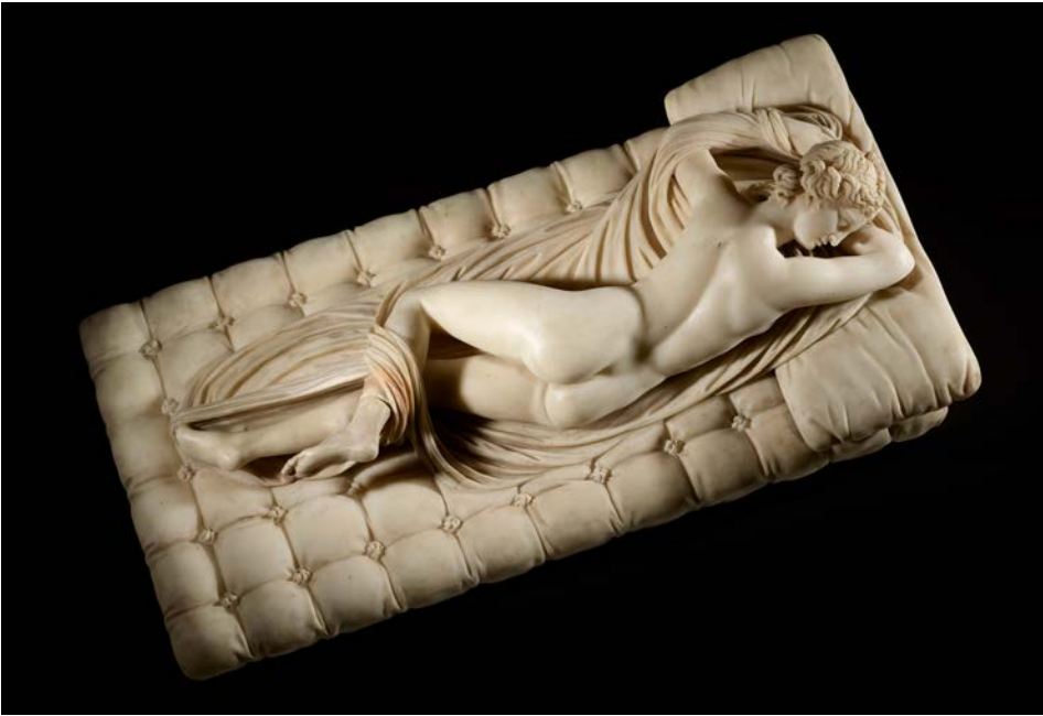
◀ Sleeping Hermaphroditus Autor desconocido Siglo II d.C, Roma (original), Siglo XIX d.C, Reino Unido (Reproducción) Mármol